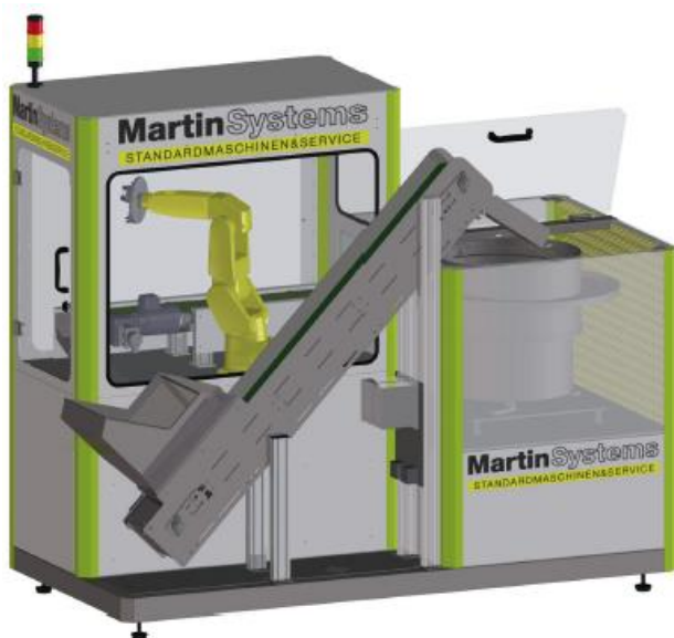
Variofeeder S. Der flexible Bestücker bringt ungeordnete Teile in eine definierte Lage.