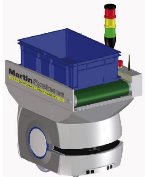
Transporter. Fahrerloses Transportsystem mit eigener Intelligenz und einer Nutzlast von bis zu 90kg.