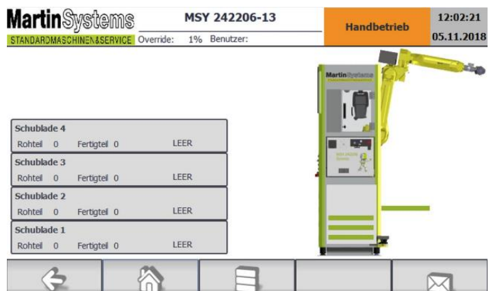
SMILE-Steuerung. Willkommen im Zeitalter der App. Mit diesem Steuerungskonzept werden auch komplexe Fertigungsaufträge durch grafische Parametereingabe einfach handhabbar.